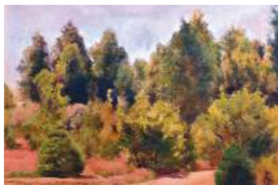
„Widok z okna domu artysty w Olszance”, olej, Liceum Ogólnokształcące im. Cz. Tańskiego w Puszczy Mariańskiej