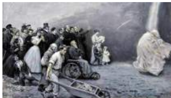
„Pochód śmierci”, 1898, Muzeum Sztuki w Łodzi