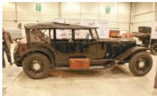
Prototypowa wersja samochodu CWS T-1, rekonstrukcja Jarosława Śliwińskiego