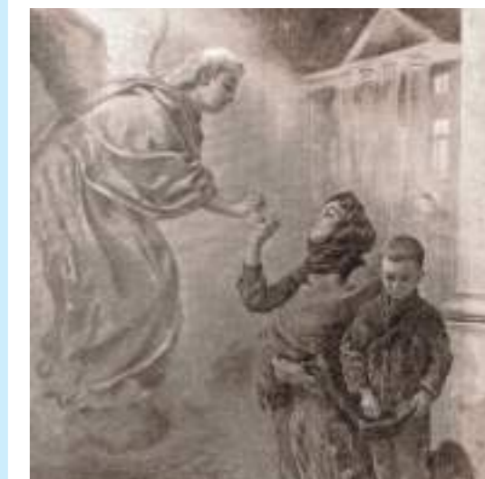
„Oplatek ubogich”, rysunek, Tygodnik Ilustrowany nr 3, 1903

Malował portrety, sceny rodzajowe i batalistyczne, pejzaże i martwą naturę. Od 1916 r. regularnie wystawiał swoje prace w warszawskiej Zachęcie.