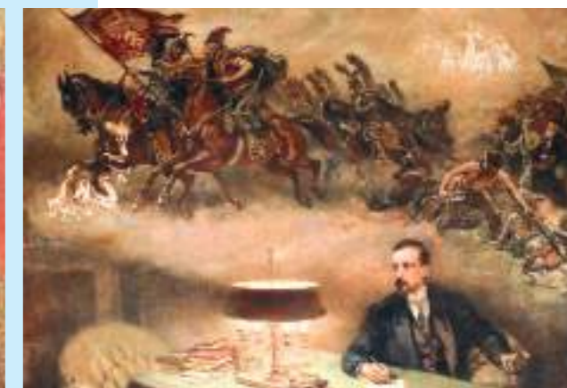
„Henryk Sienkiewicz i jego wizje”, 1905, Muzeum Literatury w Warszawie