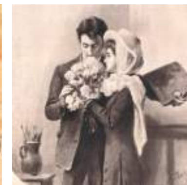
„Wiosna, malarzu, wiosna”, Tygodnik Ilustrowany, 1905