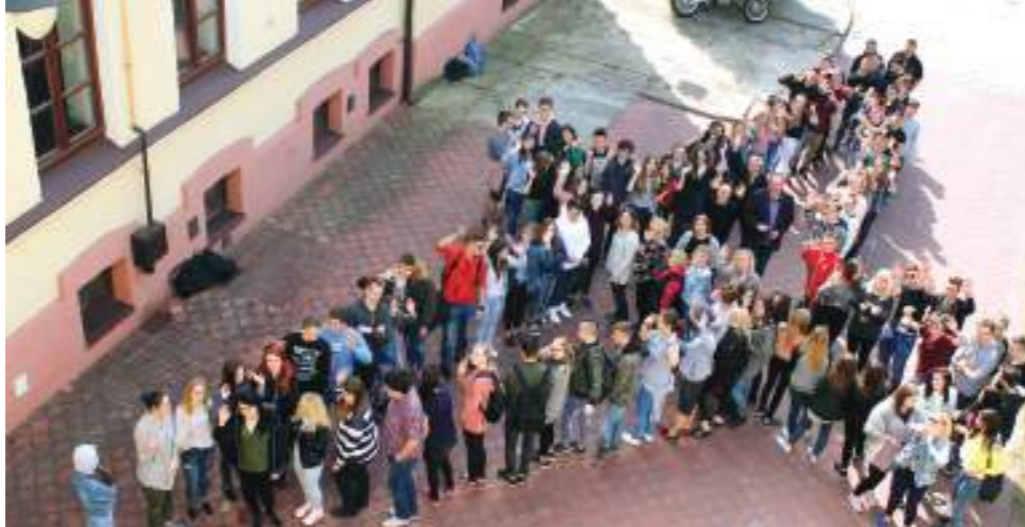
„Żywa” lotnia Tańskiego przed budynkiem Liceum Ogólnokształcącego w Puszczy Mariańskiej podczas Dnia Patrona, 06.04.2018 r.