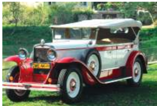
Samochód CWS T-1 Torpedo, replika stworzona przez Ludwika Roźniakowskiego