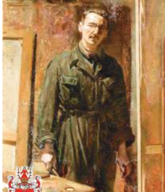
„Autoportret”, olej, 1927, Muzeum Narodowe w Warszawie

Miał pomysł stworzenia maszyny typu „skrzydła dla wszystkich”, która mogłaby szybko przenosić człowieka z miejsca na miejsce, nie wznosząc się zbyt wysoko nad ziemią. Próbował udoskonalić w tym celu swój śrubowiec z 1907 r. stworzył kilka nowych modeli, ale Instytut Techniczny Lotnictwa w 1934 r. odmówił współpracy. Liga Obrony Powietrznej i Przeciwgazowej zakupiła wtedy wszystkie jego maszyny lotnicze, które przekazano do Muzeum Przemysłu i Rolnictwa. W 1939 r. zademonstrowano je na Ogólnopolskiej Wystawie Lotniczej we Lwowie, a później w warszawskim muzeum. Uległy zniszczeniu po wybuchu II wojny światowej we wrześniu 1939 r.