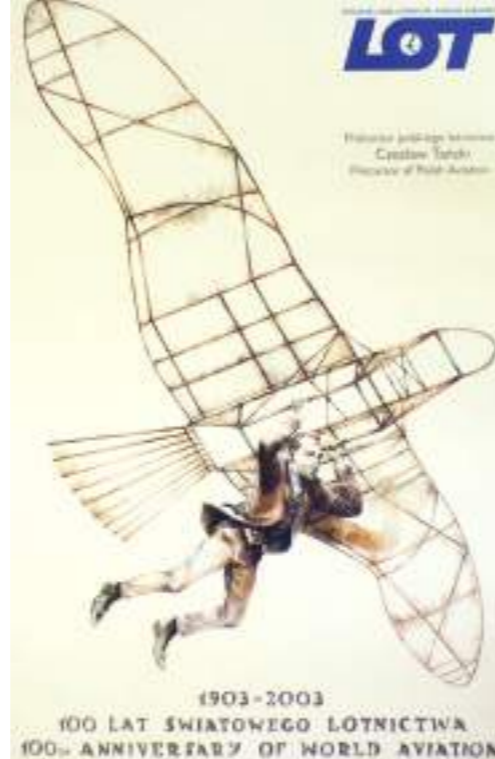
Plakat PLL LOT „100 lat światowego lotnictwa”