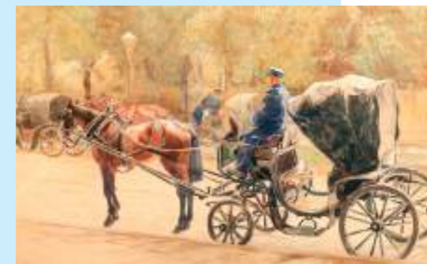
„Dorożki”, akwarela, 1903