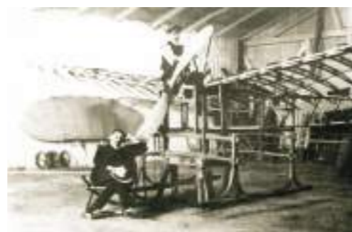
Czesław Tański przy swoim samolocie „Łątka”